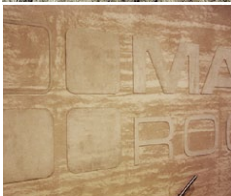
Interpretation: Relief mit Grundputz