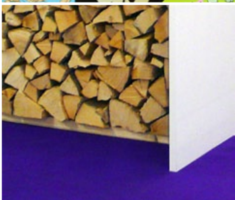
Umsetzung Farbkonzept „Rondblick“