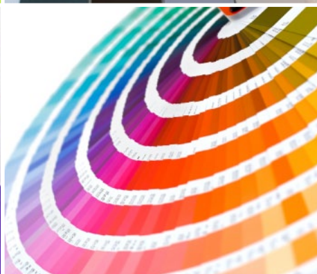
Farbsysteme: NCS, Pantone usw.