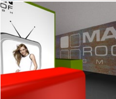
5 digitale Simulation