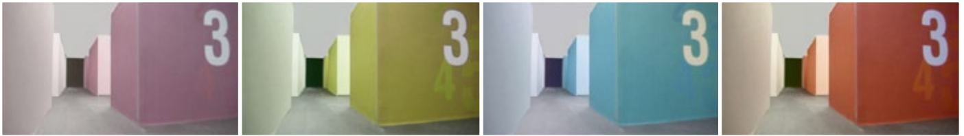
1 Modell fotografiert und Varianten in Photoshop koloriert